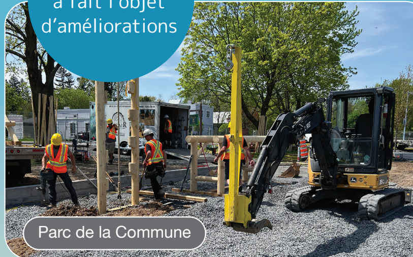
Parc de la Commune