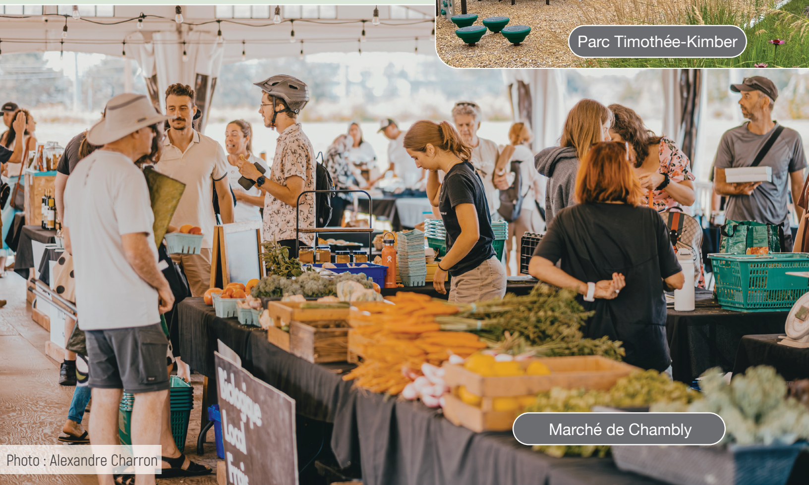
Marché de Chambly