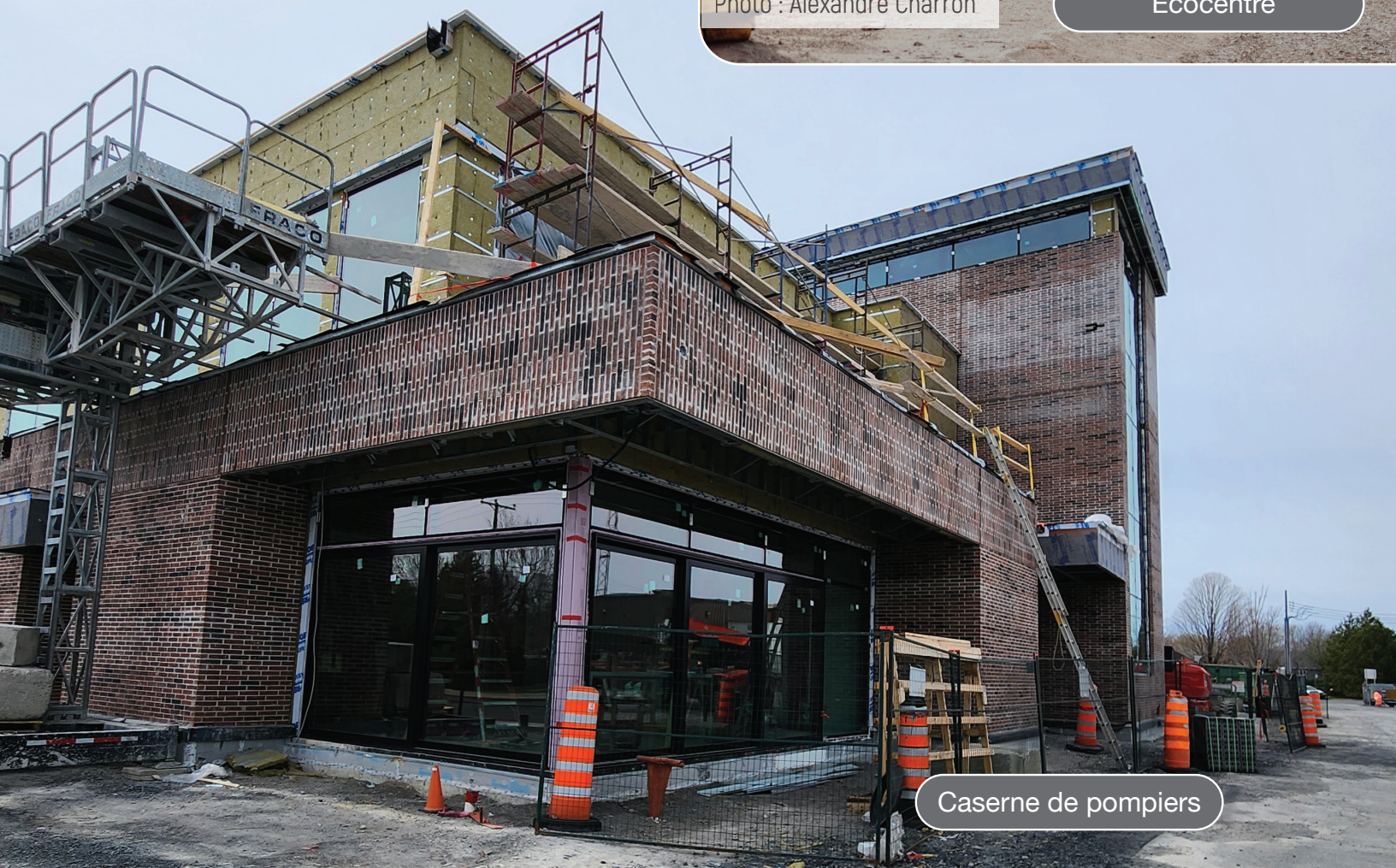
Caserne de pompiers