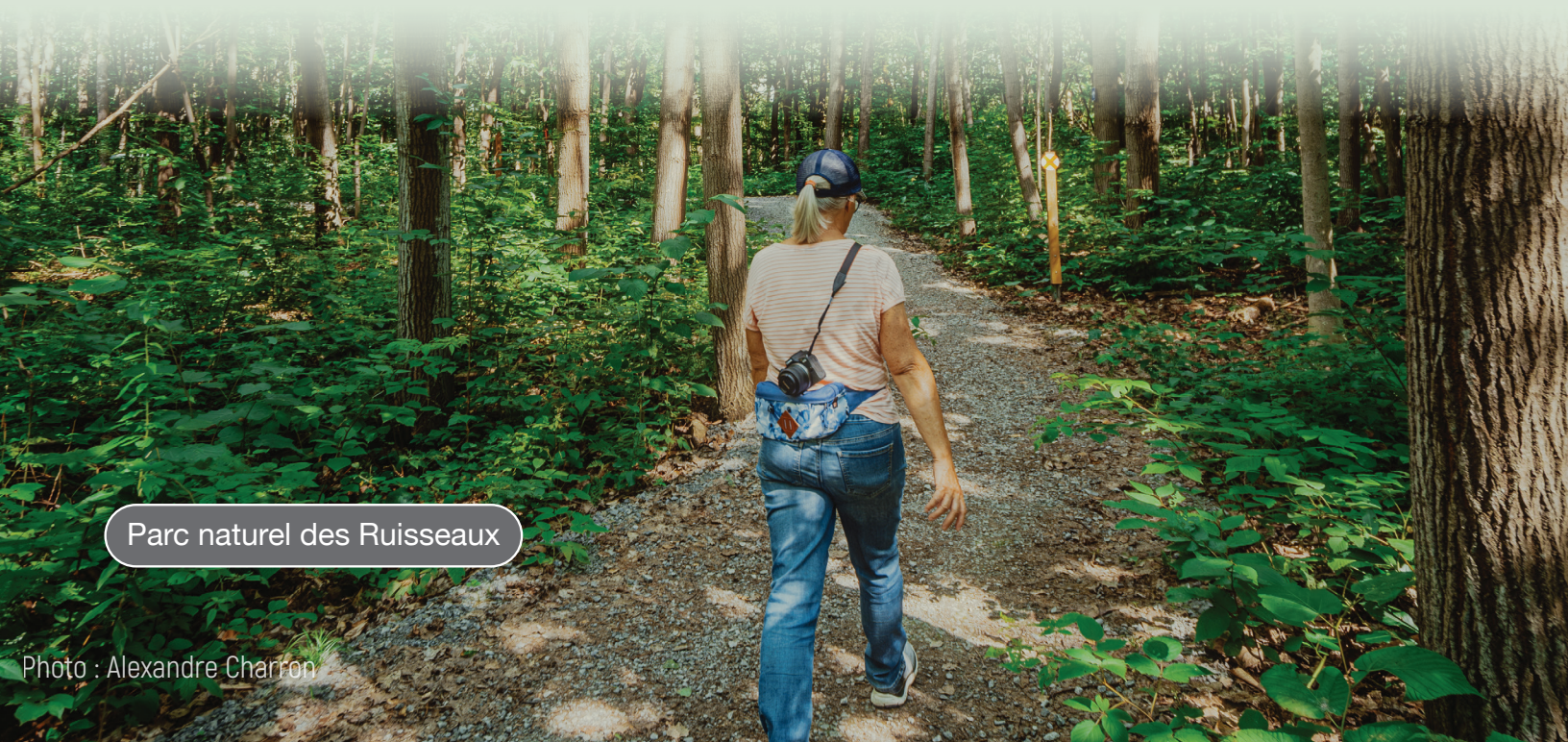
Parc naturel des Ruisseaux